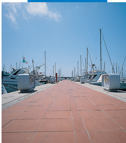
Новый порт в Чивитавеккье: укладка терракотовой наружной напольной плитки с помощью Keracrete

При укладке стеклянной мозаики на бумажной основе, особенно светлых тонов, следует пользоваться Keracrete с белым порошком Keracrete Powder White .