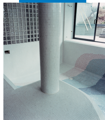
Пример укладки мозаики