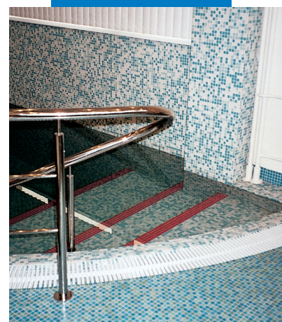
Пример укладки стеклянной мозаики