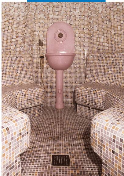
Пример укладки в турецкой бане стеклянной мозаики с помощью Keracrete и Keracrete Powder - Гостиница "Парк Отель Гритти" - Бардолино (Область Вероны)

Расширительные швы должны заполняться соответствующими герметиками фирмы MAPEI.