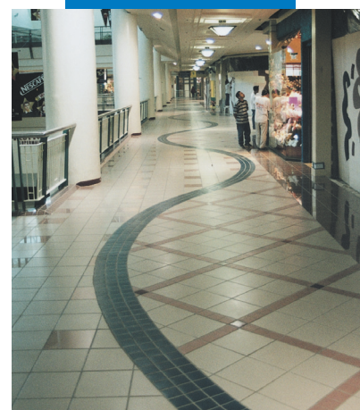
Пример укладки керамической плитки в коммерческом центре – Филинвест Фестивал Суперхол – Манила (Филиппины)