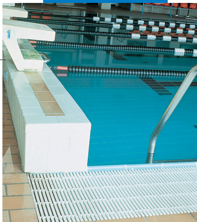
Пример использования Keracrete и Keracrete Powder для укладки мозаики в плавательном бассейне