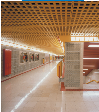
Пример укладки панелей из гранитной крошки в метрополитене - 3-я ветка - Милан (Италия)