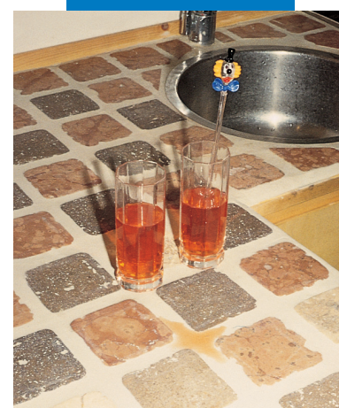
Пример приклеивания и заделки швов на кухонной стойке