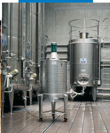
Пример заделки швов в винном производстве