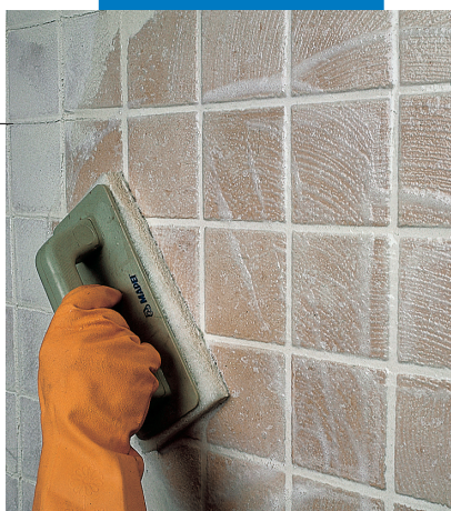
Отделка плитки одинарного обжига теркой Scotch-Brite