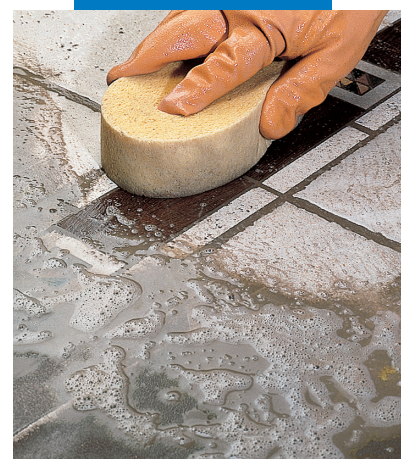
Отделка губкой керамического пола с деревянной вставкой