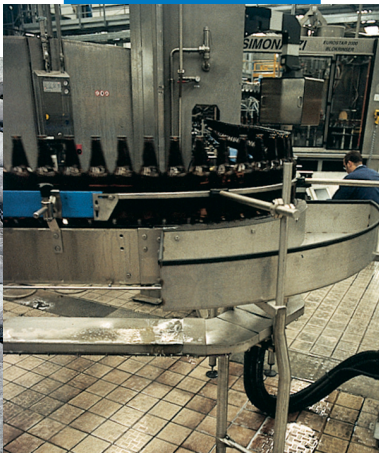
Пример заделки швов в пивном заводе

Список значимых объектов использования данного материала доступен по требованию