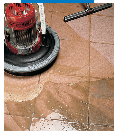
Отделка фаянсовых полов мошоеткой со скребком