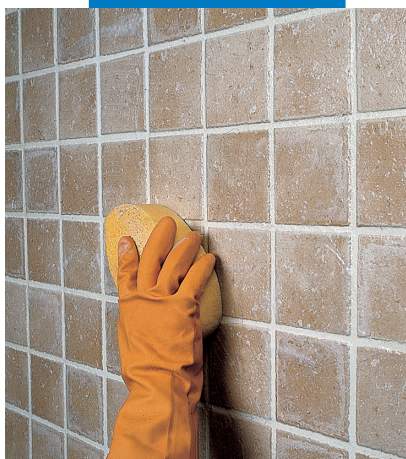
Отделка плитки одинарного обжига губкой