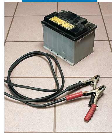
Пример заделки швов в мастерской автотехники

Смесь готовится так, как описано выше: два компонента смешиваются и наносятся на основание выбранным зубчатым шпателем. Для обеспечения хорошего контакта с клеем