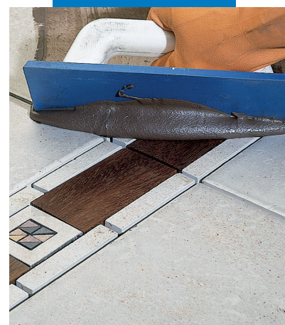
Заделка мастерком швов керамического пола с деревянной вставкой